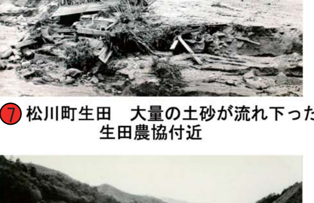
⑦ 松川町生田 大量の土砂が流れ下った生田農協付近