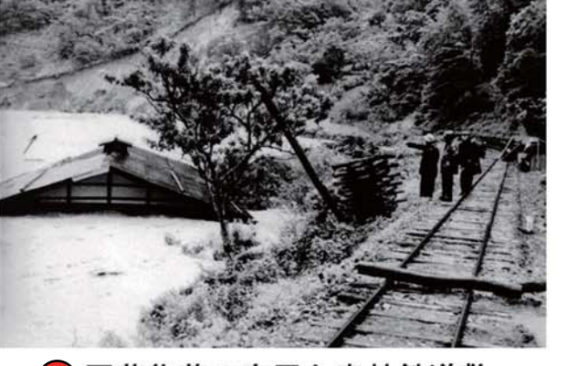
③ 戸草集落の家屋と森林鉄道敷