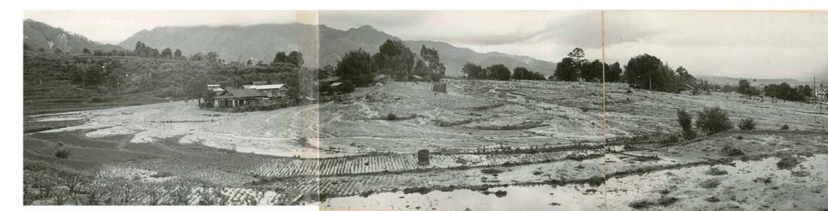
⑭ 土砂が流れ下った惨状(伊賀良)