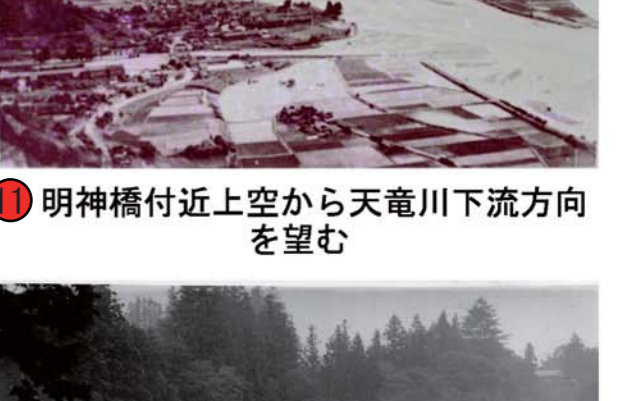
⑪ 明神橋付近上空から天竜川下流方向を望む