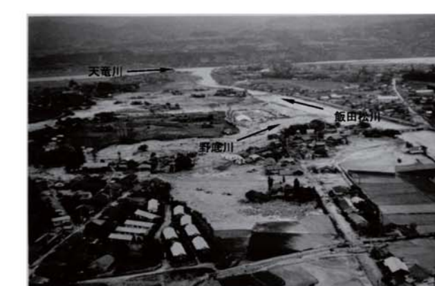
⑬ 野底川上空から飯田松川との合流点方向を望む