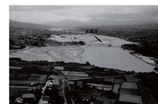
⑮ 竜丘上空から天竜川上流方向を望む