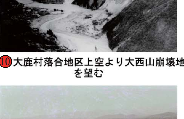
⑩ 大鹿村落合地区上空より大西山崩壊地を望む