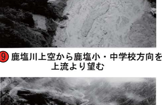
⑨ 鹿塩川上空から鹿塩小・中学校方向を上流より望む