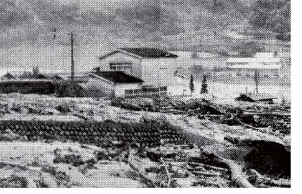
② 水田が流出し家屋が土砂で埋まった集落(旧長谷村杉島)