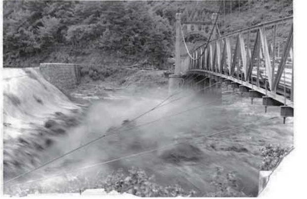
① 三峰川と黒川の合流点