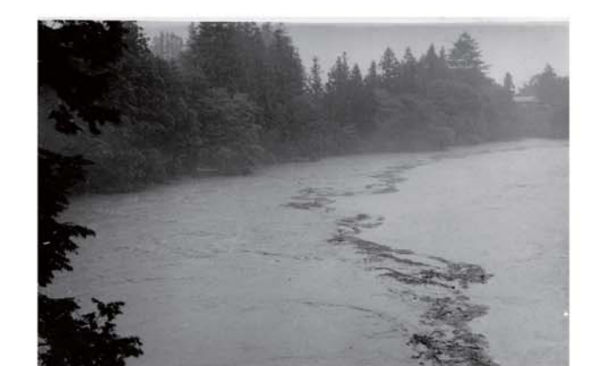
⑯ 川路太田下地先姑射橋上流の状況