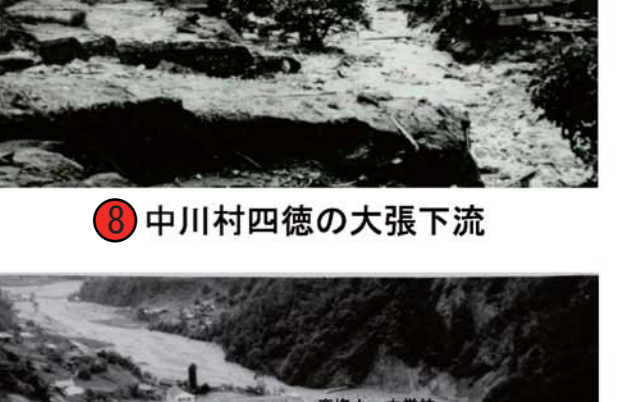
⑧ 中川村四徳の大張下流