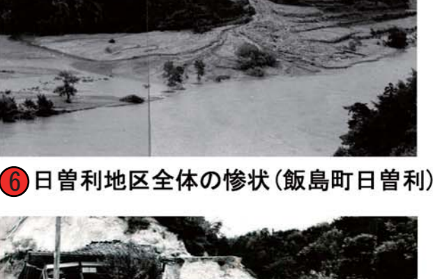
⑥ 日曾利地区全体の惨状(飯島町日曾利)