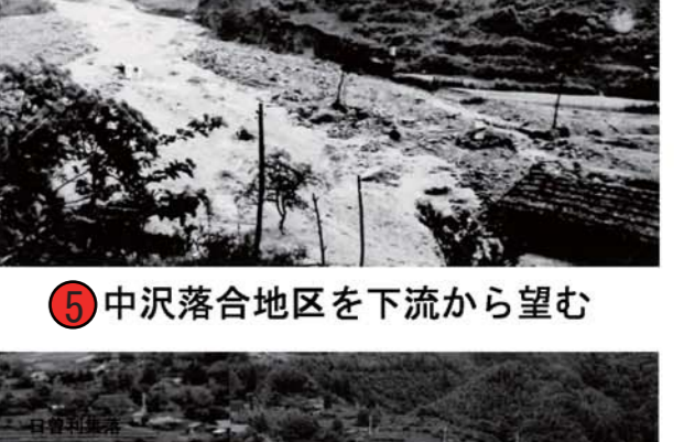
⑤ 中沢落合地区を下流から望む