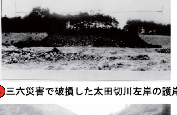
④ 三六災害で破損した太田切川左岸の護岸